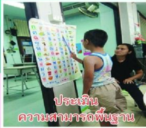
ประเมิน ความสามารถพื้นฐาน