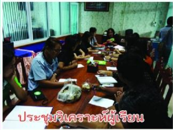
ประชุมวิเคราะห์ผู้เรียน