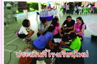
ประเมินที่โรงเรียนใหม่