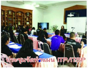
ประชุมจัดทำแผน ITP/ITSP