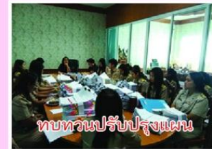
ทบทวนปรับปรุงแผน