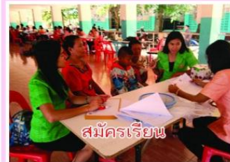
สมัครเรียน