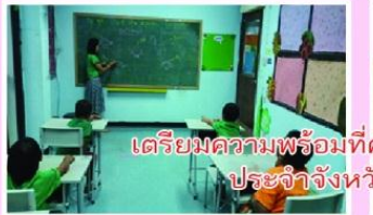
เตรียมความพร้อมที่ศูนย์การศึกษาพิเศษ ประจำจังหวัดศรีสะเกษ