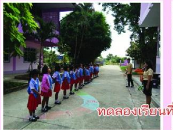
ทดลองเรียนที่โรงเรียนใหม่