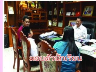
มอบตัวนักเรียน