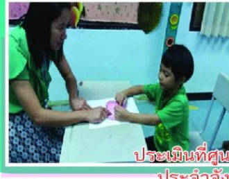
ประเมินที่ศูนย์การศึกษาพิเศษ ประจำจังหวัดศรีสะเกษ