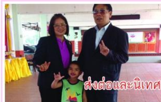
ส่งต่อและนิเทศ ติดตามหลังส่งต่อ