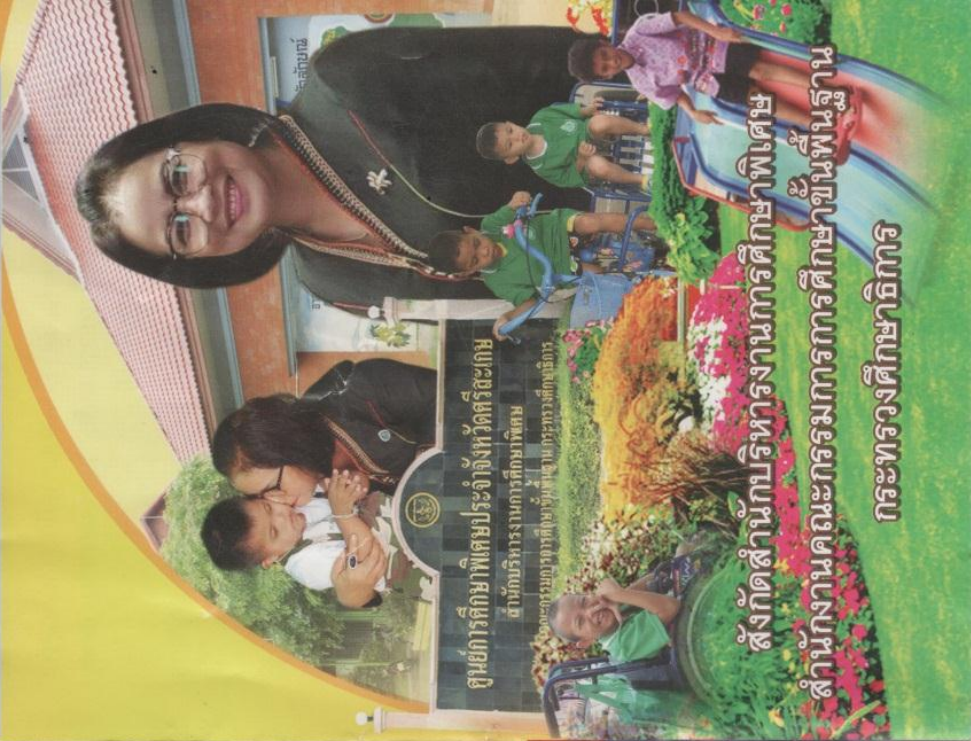
ศูนย์การศึกษาพิเศษประจำจังหวัดสระเกษ สาขาศรีนครปฐม สาขาศรีนครปฐม

บริการดี มีเครือข่ายเข้มแข็ง ใจกลางแหล่งเรียนรู้